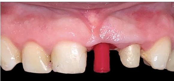
Fig. 7 Después de 6 meses se realiza la segunda fase quirúrgica