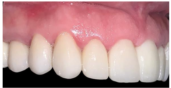
Fig. 12 Vista lateral derecha