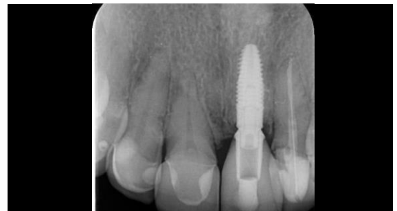
Fig. 14 Radiografía final