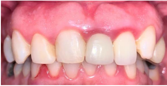
Fig. 1 Situación inicial