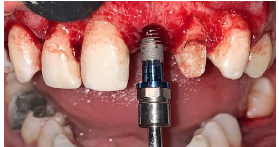
Fig. 4 Colocación del implante