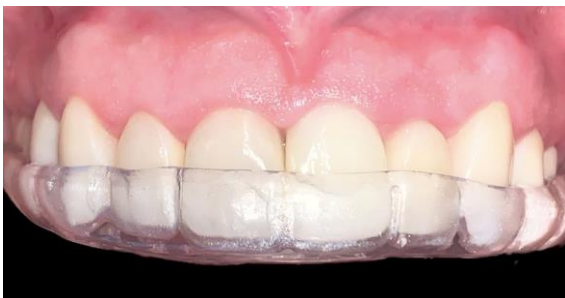
Fig. 15 Placa de estabilización