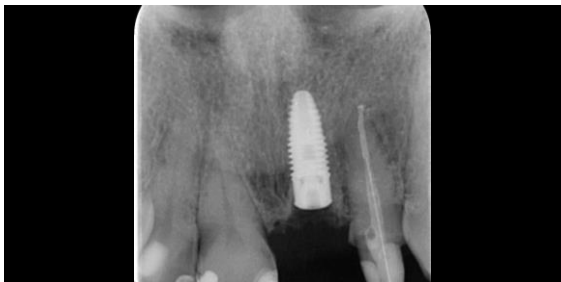
Fig. 5 Radiografía inmediata a la colocación