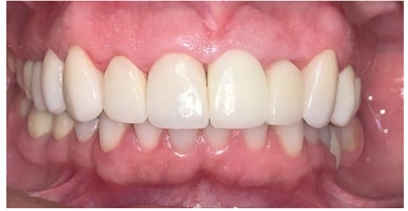
Fig. 10 Después de 6 meses carillas de cerámica