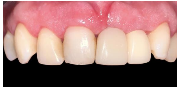
Fig. 6 Provisional Puente Maryland