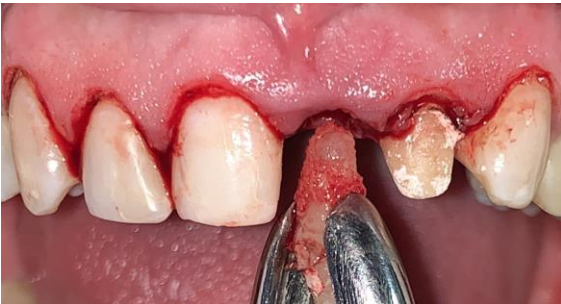
Fig. 3 Gingivectomía y extracción atraumática