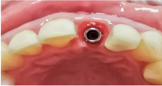
Fig. 9 Perfil de emergencia 2 semanas después