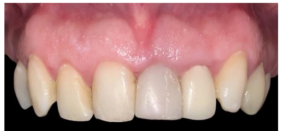
Fig. 8 Provisional para crear el perfil de emergencia