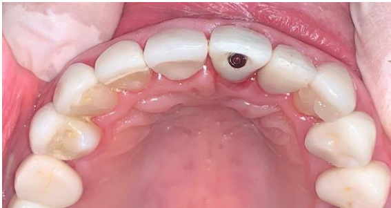
Fig. 11 Vista oclusal