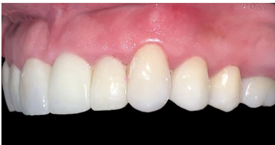
Fig. 13 vista lateral izquierda